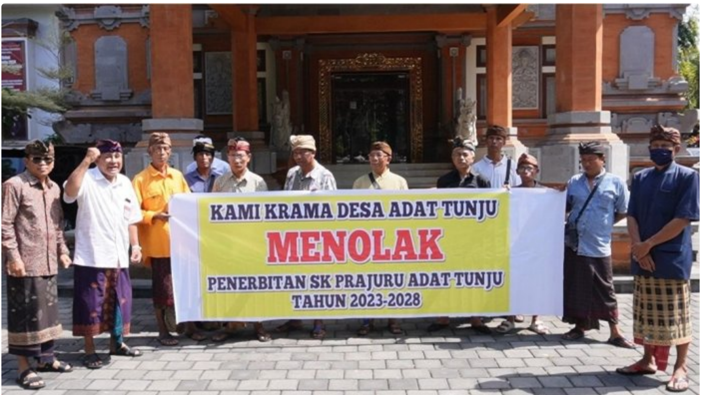
Krama Desa Adat Tunju menolak penerbitan SK prajuru Adat Tunju tahun 2023 - 2028.